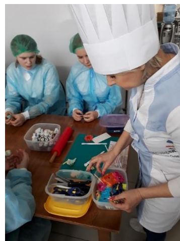
Профпробы в ТОГБПОУ "Колледж торговли, общественного питания и сервиса"